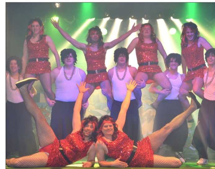
Schinnes Männer kamen zu elft auf die Kulturhausbühne der Kaiserstadt und erfreuten sowohl als Mann als auch als Frau.

Von Anke Hoffmeister Tangermünde • Nackte Männerbeine in Gummistiefeln, Männerkörper in hautengen glänzenden Overall, in Kittelschürze oder mit Tüllröckchen verziert – sie alle sorgten am Freitagabend für Entzückung. Zwar waren es nur wenige Frauen, die zur Weiberfastnacht des Tangermünder Carnivalvereins (TCV) in das Kulturhaus gekommen waren. Doch die Begeisterung für die Darbietungen litt nicht darunter.