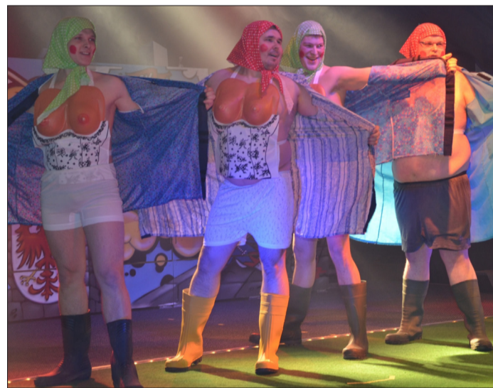
Mit Kittelschürze und Gummistiefeln sowie ausladendem Oberbau begeisterten die Rochauer Männer die Frauen.

Frauen aus Tangermünde, Havelberg und anderen Orten rundum Stendal hatten am Freitag in das Tangermünder Kulturhaus gefunden. Sie feierten Weiberfastnacht. Für Stimmung sorgten tanzende Männer.