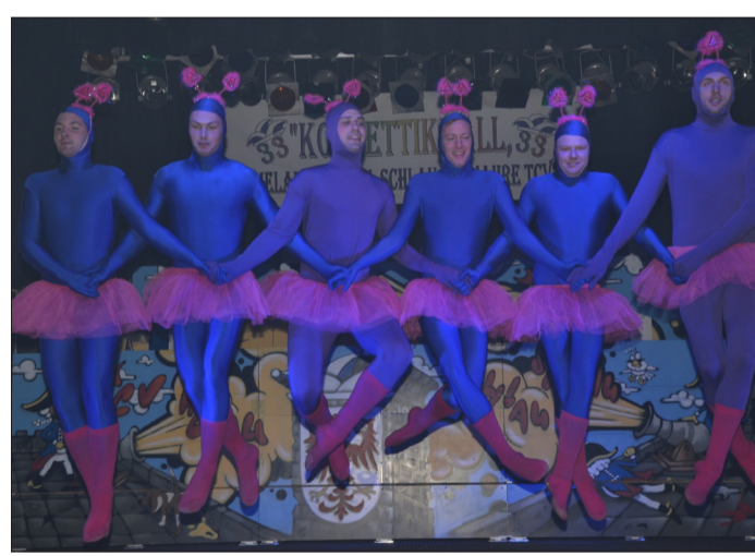
Grazil und jung kam das Männerballett des Schollener Karnevalvereins daher.

Die zahlenmäßige stärkste Riege des Abends kam aus Schinne. Elf Männer zählte dieses Ballett – stark genug, um den einen Teil als Rapper auf die Bühne zu schicken, den anderen in Frauenkleider zu stecken. Lediglich sechs Männer, dafür aber eine sehr junge und mit Abstand auch die