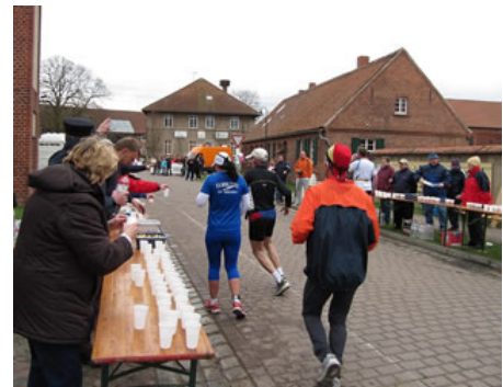
Beim NABU-Naturschutzzentrum die nächste Verpflegung

Neben den Störchen sind die ebenso zahlreichen Pferdekoppeln, die nun links und rechts der verträumten Straße nach Schelldorf zu sehen sind, typisch für die altmärkische Natur. Kurz vor Schelldorf ging es zurück auf den Elberadweg direkt am Elbdeich entlang. Den verließen die Läufer erst wieder nach gut sieben Kilometern in Tangermünde, wo es entweder für die Marathonis auf die zweite Runde oder für die Halbmarathonis in Richtung Ziel ging. Dort am mit Zuschauern gut gefüllten Marktplatz wurden sie begeistert empfangen.