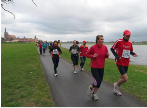
Das Halbmarathonfeld vor Tangermünde