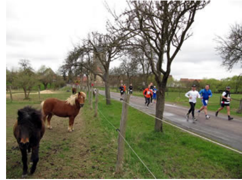
Typisch Altmark - überall Pferdekoppeln

Überhaupt konnte man viele Laufgruppen aus der Region, ob die Altmärker Dunderklumpen - benannt nach einem liebenswerten schwedischen Mitsommernachts-Troll -, die LG Haeder oder die Elbeblitze Grieben beim Elbdeichmarathon beobachten. Daneben waren etliche Gruppen aus dem Ausland am Start: die größte mit rund 40 Läufern kam aus dem dänischen Svendborg. Etwa 20 Polen gingen kurzfristig an den Start, nachdem aufgrund der Staats-Trauer im Nachbarland am Wochenende die meisten Laufveranstaltungen abgesagt wurden. Internationales Flair in der Altmark gab es durch weitere Einzelstarter aus Ägypten, Finnland oder Kanada. Die Läufer wissen, dass hier eine familiäre Atmosphäre herrscht, zudem erfreut die Laufstrecke in der Natur, eine gute Infrastruktur die Läuferherzen ebenso wie überaus niedrige Startgebühren. So kostet die Teilnahme beim Halbmarathon nur 15 Euro und beim Marathon 19 Euro. Dafür gab es sogar noch ein Funktionsshirt, die Pastaparty am Vorabend und eine Erbsensuppe im Ziel.