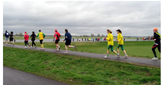
Bunte Läuferchar auf dem Elbdeich

Hier verläuft sonst der Elberadweg von Tschechien kommend über Dresden, Magdeburg und Hamburg zur Elbmündung bei Cuxhaven. Die rund 900 Kilometer lange, vom ADFC kürzlich in Berlin bereits zum 6. Mal als beliebtester deutscher Fern-Radweg gekürte Radroute stand aber an diesem Tag allein den Läufern frei. Der Elberadweg ist durchgehend gut ausgebaut, so dass auch die Laufstrecke ausschließlich über befestigte Wege führte. Auf dem Elbdeich konnte man vier Kilometer lang den Blick auf die einzigartige Flusslandschaft genießen. Da die Elbe derzeit noch Hochwasser führt - die Genehmigung für die Laufstrecke über den Deich konnte daher erst in der Vorwoche erteilt werden - Wasser soweit das Auge blickt. Natürlich ein Paradies für viele Vogelarten: Störche, Reiher und sogar Milane kann man hier beobachten.