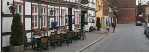
Typisch Tangermünde - Gastronomie und Kultur in historischem Ambiente