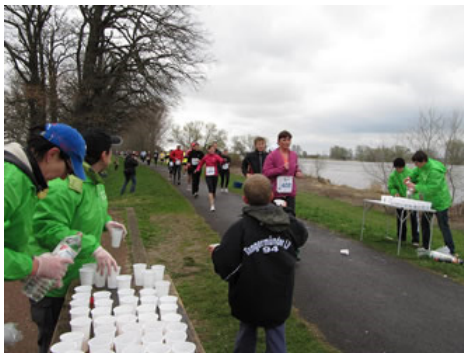
Alle 4km warteten freundliche Helfer mit Verpflegung