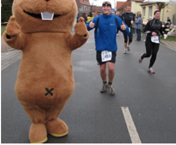
Der Elbibber feuert die Läufer an