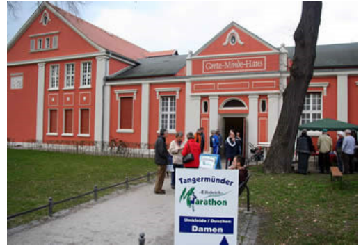
Marathonmesse - Meldebüro und Pasta-Party im Grete-Minde-Haus

Zu den acht Hansestädten der Altmark gehört die knapp 10.000 Einwohner zählende Klein-Stadt Tangermünde. Backsteinbauten, die fast geschlossene, gewaltige Stadtmauer mit den wehrhaften Toren, die Burganlage und die vielen Fachwerkhäuser verleihen der Kleinstadt an der Elbe einen einzigartigen Charme. Doch nicht nur steinerne Zeugen der Vergangenheit machen den Reiz der Stadt aus, auch das vielfältige kulturelle und gastronomische Angebot, oft in historischem Ambiente dargeboten. Wer das Umland der Stadt und die Schönheiten der Natur kennen lernen möchte, kann dies bei einer Wanderung oder einer Radtour durch die Elbtalauen, einer weiträumigen Flusslandschaft, die Lebensraum zahlreicher Pflanzen- und Tierarten ist. So ist das idyllische Tangermünde heute Anziehungspunkt vieler Touristen.