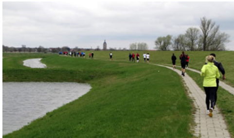
Am Elbdeich entlang zurück nach Tangermünde