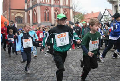
Zunächst hatten die Kleinen ihren Spaß beim Kinderlauf