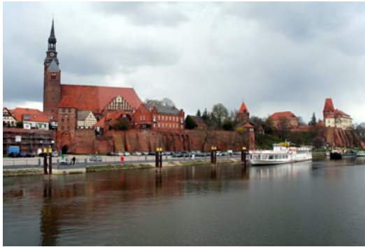
Tangermünde - 1000jährige Stadt an der Mündung der Tanger in die Elbe